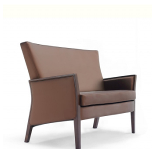
Iris 5221 avec accoudoirs en bois