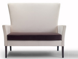
Iris 5121 + 0401 avec dossier haut